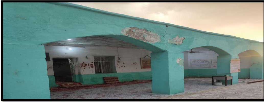
الشكل (8) : يوضح أماكن استراحة (لواوين) لمركز العباس الهادي

ويحتوي المرقد على الكثير من أماكن الاستراحة وهي ما تعرف بـ (لواوين)، وتخصص هذه ( اللواوين ) للاستراحة أو المبيت لمن يرغب في ذلك، ويوضح الشكل (8) ذلك.