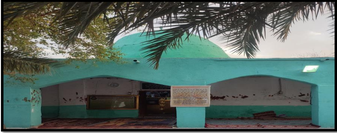
الشكل (7) : يوضح الطراز التراثي لمركز العباس الهادي