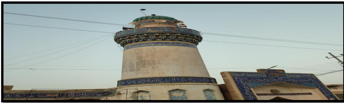
الشكل (12): جامع الرسول ومأذنته (ص)