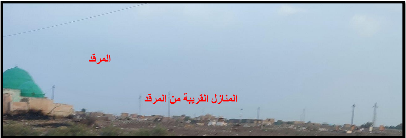
الشكل (9) : المنازل القريبة من مركز العباس الهادي (ع)

وقد لوحظ كثير من المنازل التي تقع بالقرب من المقام الشريف، وهذا يمثل نشأة أحياء سكنية جديدة خلف المرقد، وبهذا فإن الأماكن الدينية تؤدي وظيفة مهمة وهي التكوين العمراني لتلك المنطقة، وكما هو موضح في الشكل (7).