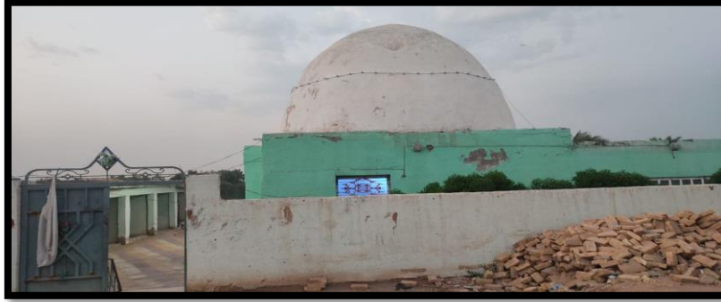
الشكل (2): يبين مرقد الخضر

ويُعدّ مرقد الخضر من أبرز الأماكن الدينية في مدينة الفضلية وتم تأسيس هذا المرقد في منتصف القرن الماضي وكان بناؤه أول وهلة بناءً بسيطاً جداً من ( الطين والبواري وجريد النخيل ) ثم أجريت له بعد ذلك حملات أعمار عدة، كان آخرها الحملة في عام (2015)، ويبين الشكل (2) صورة المرقد، وكذلك يبين الشكل (3) المزارات والأماكن الدينية.