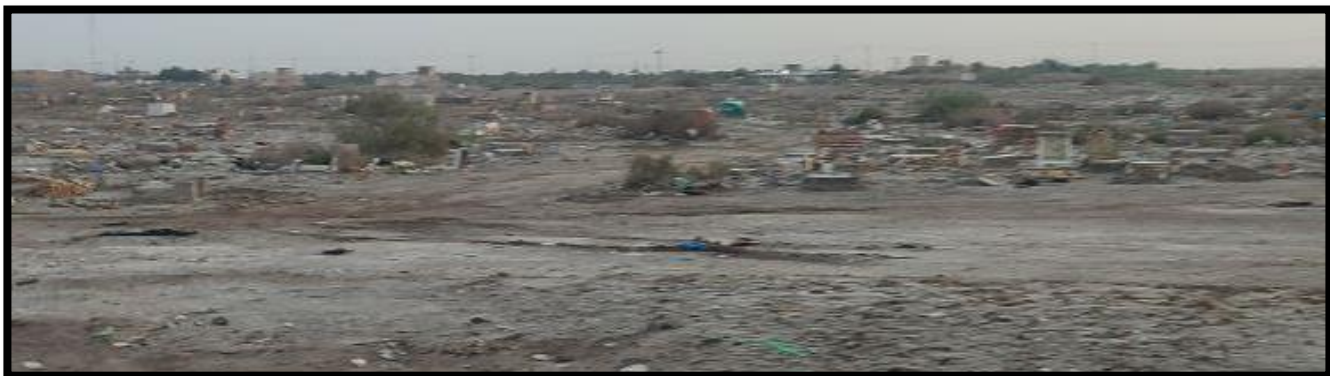
الشكل (10) : مقبرة مرقد العباس الهادي (ع)

ومن الملاحظ أيضًا وجود مقبرة تابعة إلى هذا المرقد كما هو موضح في الشكل (10)، وهي مخصصة لدفن الأطفال الصغار أو الرضع الذين يموتون بسن مبكرة من العمر فيدفعهم ذورهم فيها، ولا سيما مناطق جنوب ذي قار (الفضلية - سوق الشيوخ -