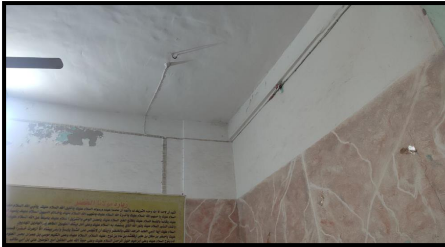
الشكل (4): يبين مرقد الخضر من الداخل بعد إكسائه بمادة السيراميك

وتطور العمل في مقام الخضر إذ تم بناءه بصورة منتظمة واستعمل السيراميك في إكساء داخله من أجل إضفاء جمالية أكثر عليه، كما