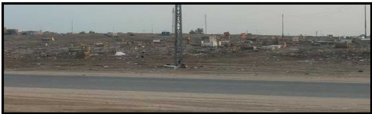
الشكل (11) : المعوقات في مقبرة مرقد العباس الهادي (ع)

أن من أهم المعوقات التي يعاني منها هذا المرقد عدم وجود تخطيط أو حدود فاصلة بين الأراضي المخصصة للمرقد والأحياء السكنية، وعدم تسييج المقبرة المجاورة للمرقد بسياج خاص بها، ومحاذاتها للشارع العام بدون سياج، كما يتضح في الشكل (11)، ما يؤدي إلى خوف بعضهم من تجول أطفالهم فيها ، وكذلك عدم استغلال