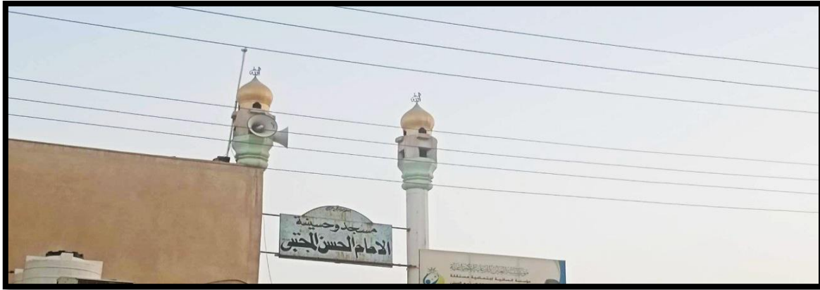
الشكل (14) : جامع وحسينة الإمام الحسن المجتبي (ع)

أن وجود حسينيات في أماكن تشهد توسعاً عمرانياً يكون جاذباً للسكان لأن بعض الأشخاص ولاسيما الكبار في السن يرغبون في الأماكن الدينية ما يسهم في ارتفاع سعر الأرض المجاورة للحسينية.