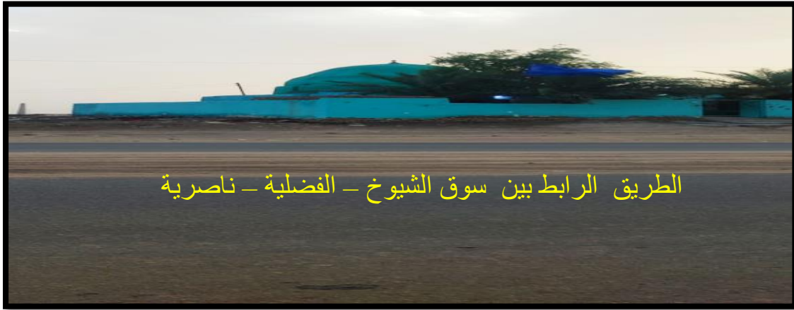
الطريق الرابط بين سوق الشيوخ - الفضلية - ناصرية

وهناك معوقات عدة يعاني منها المرقد أهمها عدم تبليط الشوارع المؤدية إلى المرقد ولا سبّما الشارع الرابط بين المرقد و طريق الفضلية العام الذي يربط بين سوق الشيوخ - ناصرية، وكذلك