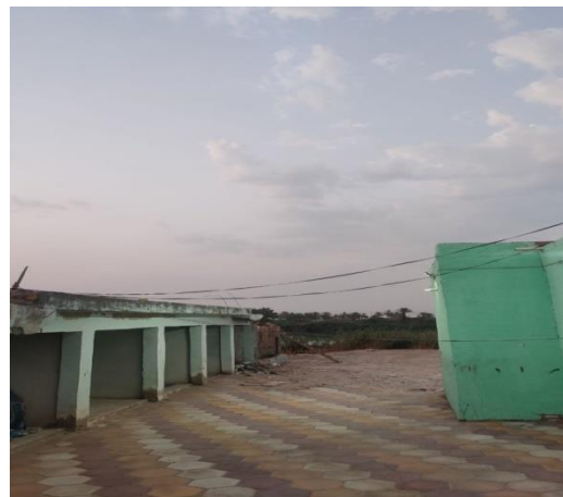
الشكل (5): يوضح إطلالة مرقد الخضر على نهر الفرات