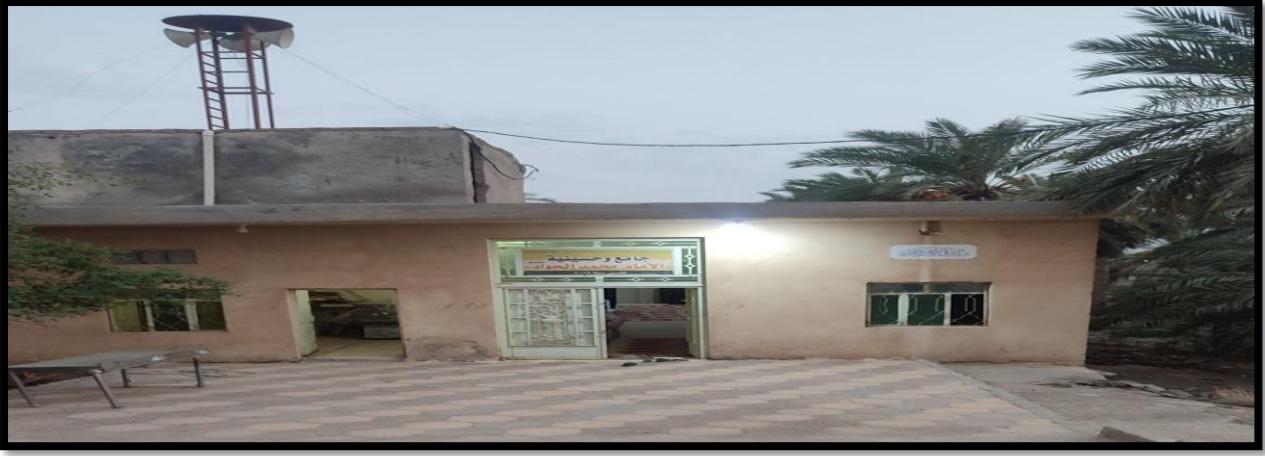
الشكل (13) : جامع وحسينة الإمام الجواد (ع)